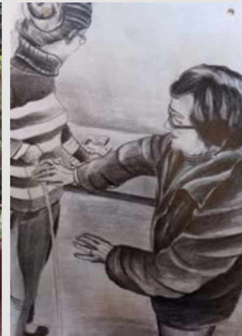
"El camino de una mujer" Autor: José Daniel Stibe Técnica utilizada: Dibujo Año de realización: 2021 Medidas: 23 x 32 cm